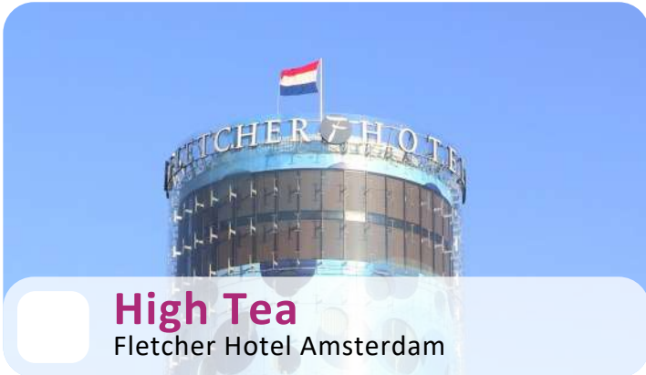
High Tea Fletcher Hotel Amsterdam