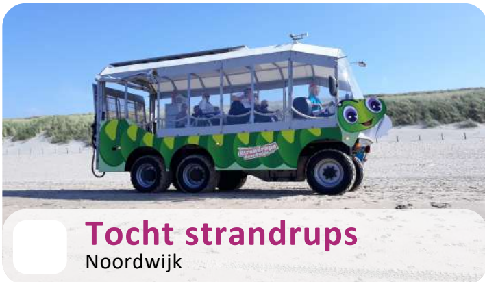
Tocht strandrups Noordwijk