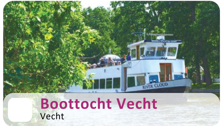
Boottocht Vecht Vecht