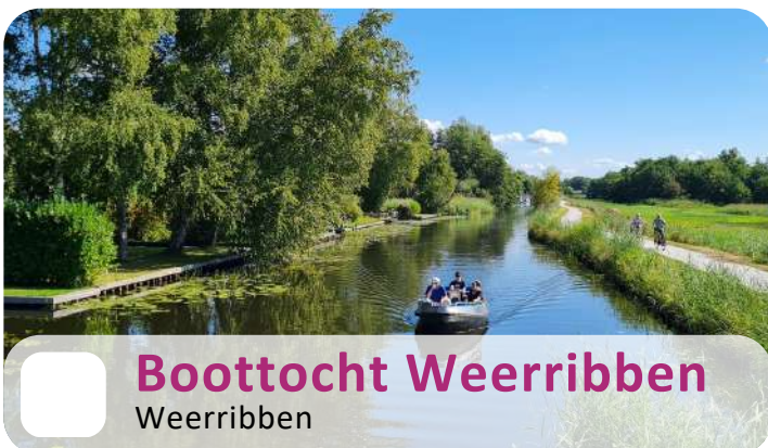
Boottocht Weerribben Weerribben