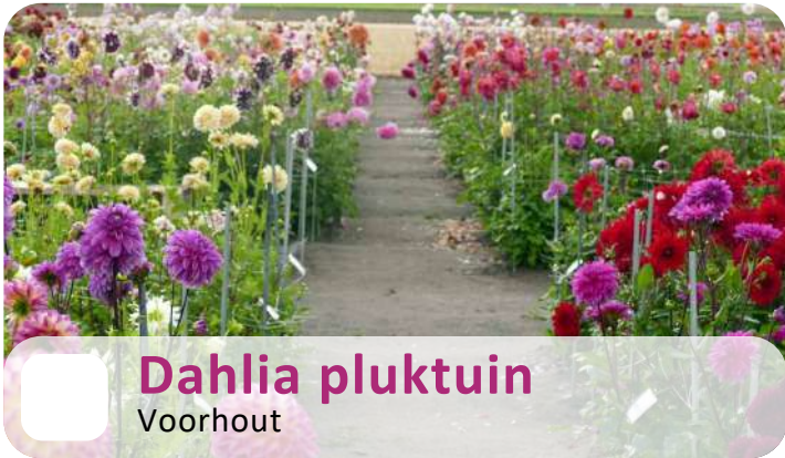
Dahlia pluktuin Voorhout