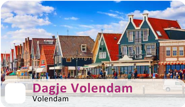
Dagje Volendam Volendam