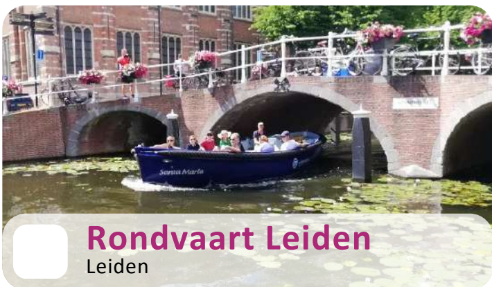
Rondvaart Leiden Leiden