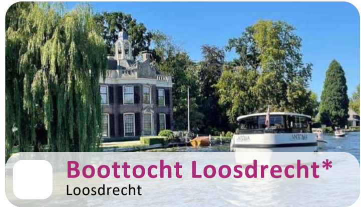
Boottocht Loosdrecht* Loosdrecht