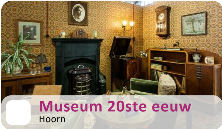
Museum 20ste eeuw Hoorn