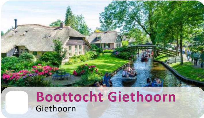
Boottocht Giethoorn Giethoorn