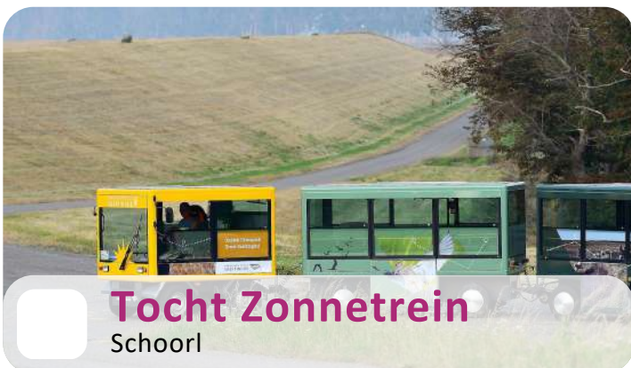
Tocht Zonnetrein Schoorl