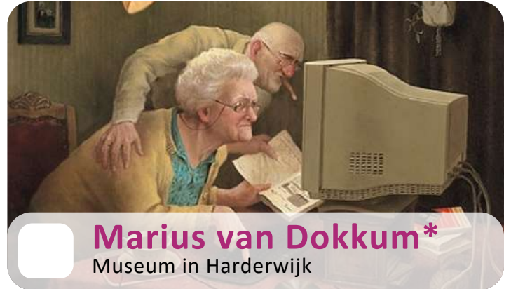
Marius van Dokkum* Museum in Harderwijk