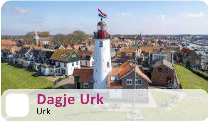
Dagje Urk Urk