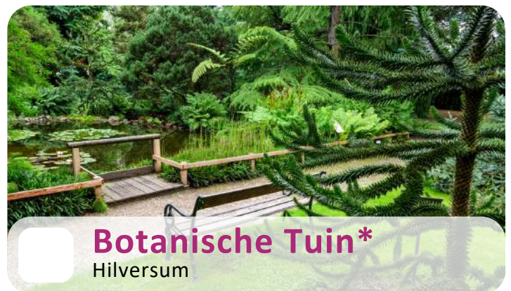
Botanische Tuin* Hilversum